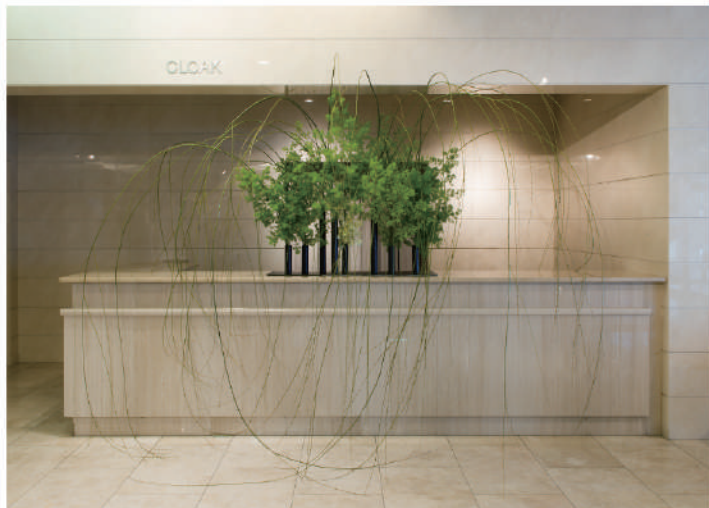
2018年 グランビリオホテル(徳島市)個展作品