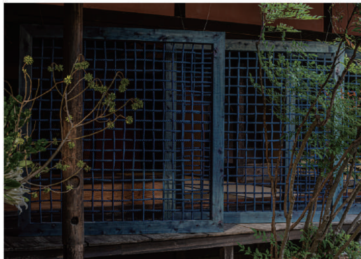
2021年 藍商佐直 吉田家住宅(美馬市)で開催された「うだつ藍と花」展にて展示されたロープ作品「Net」 ※本展でも展示予定